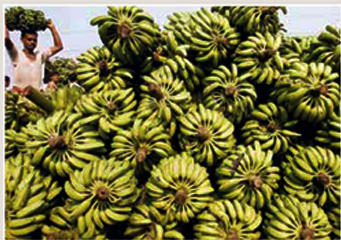
קטיף בגנות מוכן למשלוח